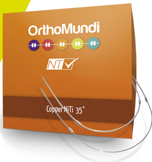
Arcos Copper NiTi 35°

Fio termoativado com composição de cobre.